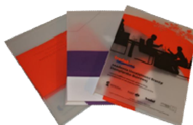
Segregatory z nadrukami