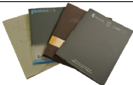
Segregatory z nadrukami